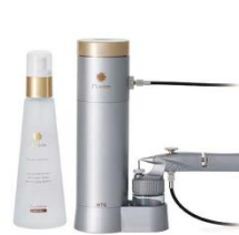
スカルプエイジングケア化粧水