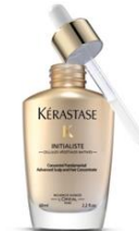
スカルプエイジングケア美容液

時間：40min 3回コース：¥11,025- (1回につき525円お得) 6回コース：¥18,900- (1回につき1,050円お得)