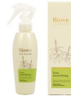
毛乳頭ケアエッセンス