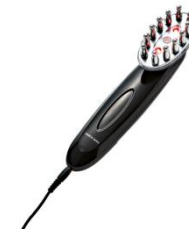
赤色LEDによる頭皮ケア

時間：45min 3回コース：¥15,750- (1回につき525円お得) 6回コース：¥28,350- (1回につき1,050円お得)